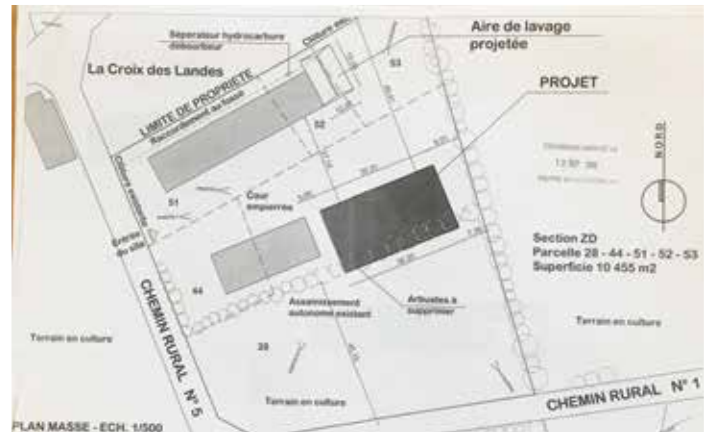
Plan de masse du bâtiment-atelier