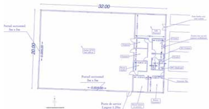
Plan de masse du bâtiment-atelier