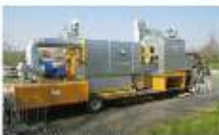
Toasteur de grains