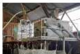
Deux types de trieurs : à grilles et électronique (44-85)