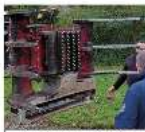
Grappin coupeur sur pelle