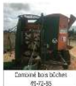
Combiné bois bûches 49-72-85