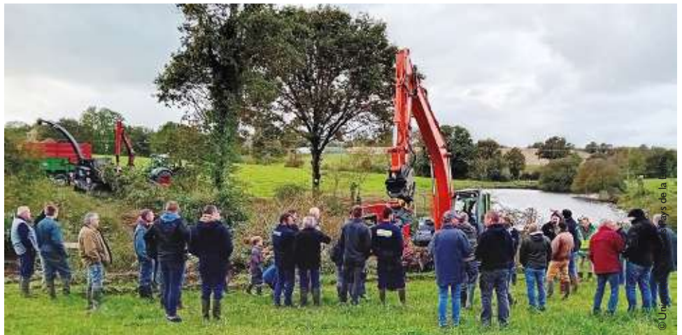
De la démonstration à la réflexion. ■

Les participants ont pu voir en action une pelle avec pince d'abattage de la société Guette TP ainsi que la déchiqueteuse des cuma Défis 85 et Du Bocage (79). Au-delà des explications sur la partie technique en jeu lors des opérations d'abattage et de déchiquetage, les intervenants ont également abordé la construction d'une filière locale. Au pied de la haie, collectivités et agriculteurs ont pu échanger sur leurs attentes respectives pour voir naître une dynamique locale.