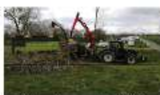
Déchiqueteuse de bois 49-72-85