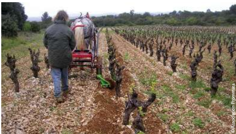
Une écurie en commun pour répondre à des créneaux de niche

Et si l'innovation pouvait radicalement passer par la traction animale ? Cela peut paraître déroutant, mais pas tant que ça. En effet, en France, certains secteurs géographiques, de par leur relief, leur labélisation ou leurs cahiers des charges, doivent y avoir recours. Ainsi à Grasse dans les Alpes-Maritimes, des marques de luxe exigent qu'on récolte les plantes à la main, sans mécanisation de type tracteur et outils, afin de préserver entièrement la culture et les feuilles. La traction animale en cuma peut donc s'envisager afin de combler des exigences particulières. Acheter des chevaux, ou autre animal en commun, permettrait de partager les frais de nourriture, d'eau, de vétérinaire et de travailler les parcelles, en général de petites surfaces (1 à 5 ha). Pour ainsi éviter d'acheter son propre animal, de l'héberger obligatoirement à la ferme et de le nourrir soi-même. ■