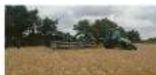
Ecimeuse ramasseuse 12 m