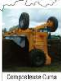
Composteuse Cuma 44-49-85