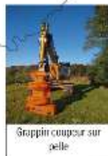
Grappin coupeur sur pelle

Des innovations et des services, à disposition de tous les agriculteurs de la région