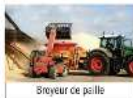
Broyeur de paille