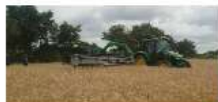
Ecimeuse ramasseuse 12 m