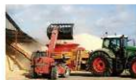
Broyeur de paille