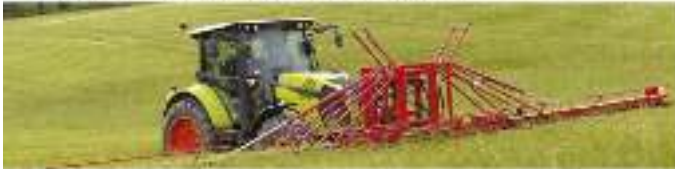
ÉCIMEUSE POUR CULTURE BIO & CONVENTIONNELLE de 6,50 à 12,50 m de coupe.