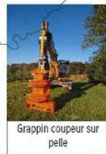
Grappin coupeur sur pelle

Des innovations et des services, à disposition de tous les agriculteurs de la région