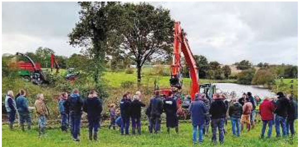
De la démonstration à la réflexion. ■

Les participants ont pu voir en action une pelle avec pince d'abattage de la société Guette TP ainsi que la déchiqueteuse des cuma Défis 85 et Du Bocage (79). Au-delà des explications sur la partie technique en jeu lors des opérations d'abattage et de déchiquetage, les intervenants ont également abordé la construction d'une filière locale. Au pied de la haie, collectivités et agriculteurs ont pu échanger sur leurs attentes respectives pour voir naître une dynamique locale.