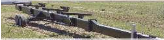
PORTE-COUPPE MOISSONNEUSE BATTUEUSE système de fauchage par inertie, hydraulique et frein de secours.

WWW.MICHELETTI.FR Fabrication Française & Distribution depuis 1991