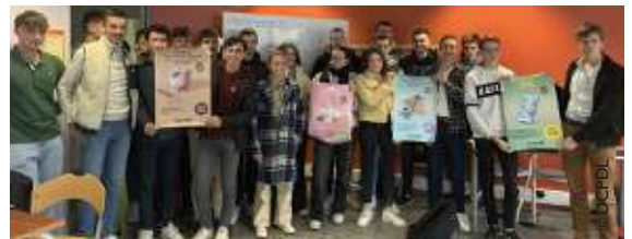
Les élèves de BTS ACSE I du campus de Pouillé préparent une enquête.

Les élèves de BTS ACSE I du campus de Pouillé ont pour mission de déployer une enquête à destination des responsables de cuma et en lien avec le nouveau projet politique de l'Union des cuma. Voici les mots et expressions employés lorsqu'on leur demande de caractériser l'enjeu de ce travail : "découverte", "aider les cuma à travailler sur leur avenir", "c'est pour notre avenir à nous aussi, si on s'installe", "ouverture", "créer du lien", "développer un réseau". ■