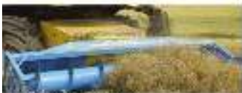
PICK-UP SHELBOURNE pour récoltes d'été et d'automne