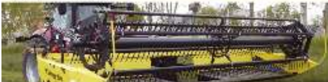
FALCHEUSE ANDAINEUSE HONEY BEE de 4 à 12 m