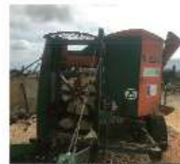
Combiné bois bûches 49-72-85