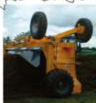
Composteuse Cuma 44-49-85