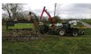
Déchiqueteuse de bois 49-72-85