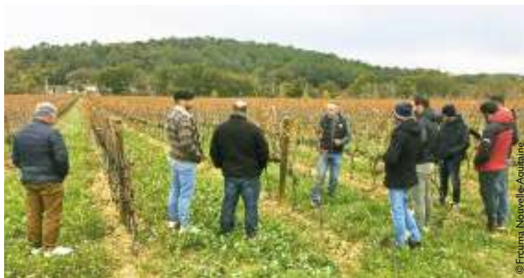
Les viticulteurs landais ont même créé un GIEE. ■

Face au constat des pertes de surfaces viticoles dans le secteur de Geaune (40), les acteurs locaux (Cave coopérative du Tursan et cuma) se sont mobilisés. Ils ont créé une SCEA pour l'entretien des parcelles sans reprise, en attendant des nouvelles installations (vente ou location) ou agrandissements. Puis mis en place une cuma spécialisée dans le traitement. Un groupement d'employeurs assure le fonctionnement de la SCEA et la prestation complète traitement. Ensuite, les cuma impliquées ont fusionné pour proposer une offre globale, de la plantation à la récolte. L'augmentation du nombre d'adhérents témoigne du succès de l'initiative. ■