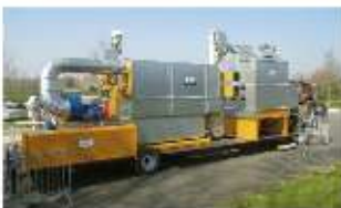
Toasteur de graines