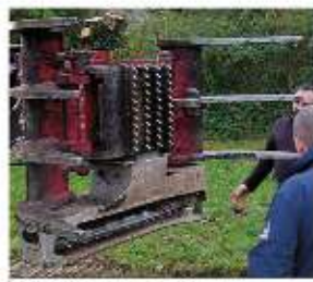
Grappin coupeur sur pelle