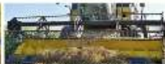
TAPIS DE RÉCOLTE MICHELETTI adaptables toutes marques

NOUS CONTACTER : LE BUREAU À RENNES 02 97 78 07 17 ROUTE DE LA BARRIÈRE 35170 PERLETTRE 05 33 05 40 08 - 06 06 63 23 17