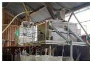
Deux types de trieurs : à grilles et électronique (44-85)