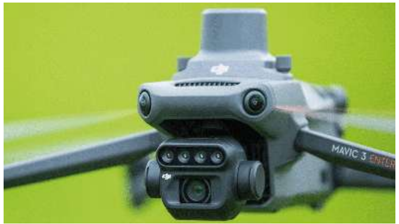
Un pilote et un réparateur de drones employés par la cuma. ■

Dans la partie activités innovantes en cuma citons... le drone. Aujourd'hui, les drones ne sont pas encore en cuma, mais il se peut que certaines soient déjà en réflexion. En effet, le drone est capable aujourd'hui d'analyser les cultures et, à partir des données récoltées, de réaliser par la suite des cartes de préconisations. Pourquoi ne pas pousser le vice plus loin ? En fonction de ce que l'on recherche, on peut imaginer un achat groupé de drones pour des cuma ou, au sein même d'une cuma avec un mécanicien qui pourrait réparer du matériel agricole jusqu'à la plus petite échelle qu'est le drone. Un autre salarié s'occuperait de le faire voler et ensuite d'extraire les données pour les analyser et les intégrer dans une carte de modulation ou de préconisation. ■