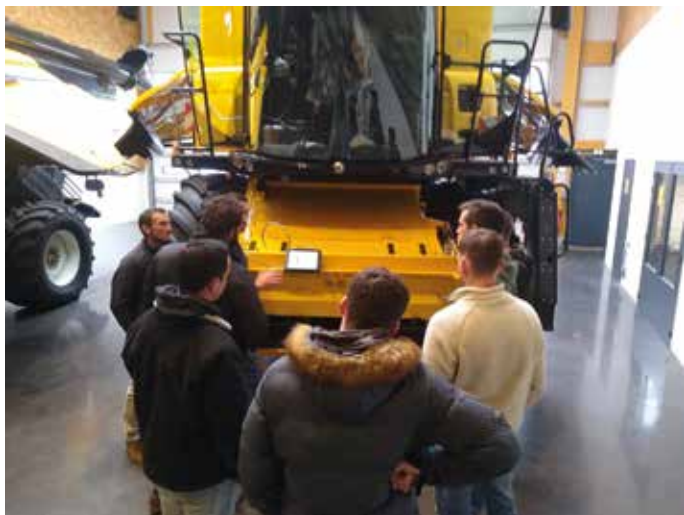
L'intervenant du constructeur reprend les fonctionnalités de l'ordinateur et indique les points de réglages liés.